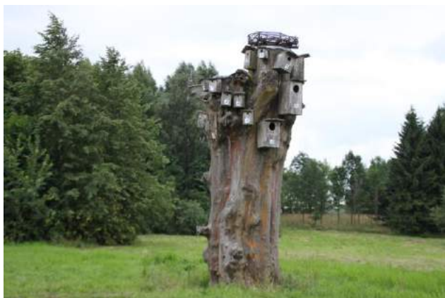
Putnu būrišu debesskrāpis.