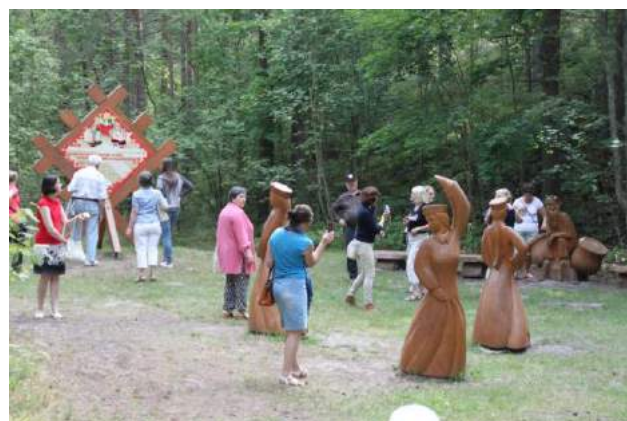
Rit sirsnīgas sarunas ar Lejaskurzemes tautu meitām.