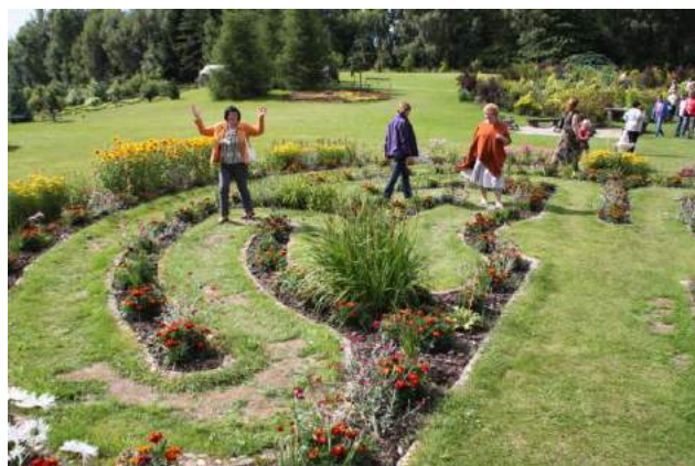
Vai sajūtat labirinta enerģētiku?!