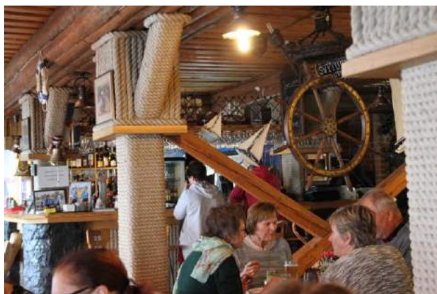
Kas atteiksies no žemaišu nacionālo ēdienu baudīšanas?! Laba maltīte stiprina ceļiniekus.