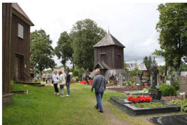
Etnogrāfiskais ciematiņš Beržora, kura rota ir grezna koka baznīca.