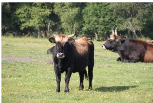
Papē. Redzi nu, statistiķi beidzot atbraukuši!