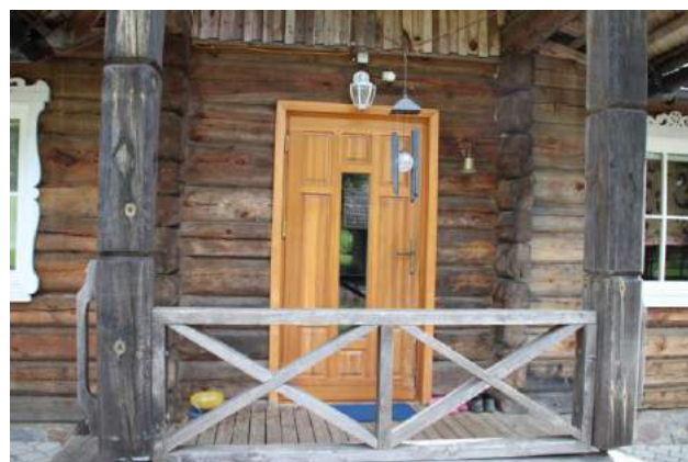
Skaists lievenis jau Lietuvas pusē. Kā to viņi dabū gatavu?