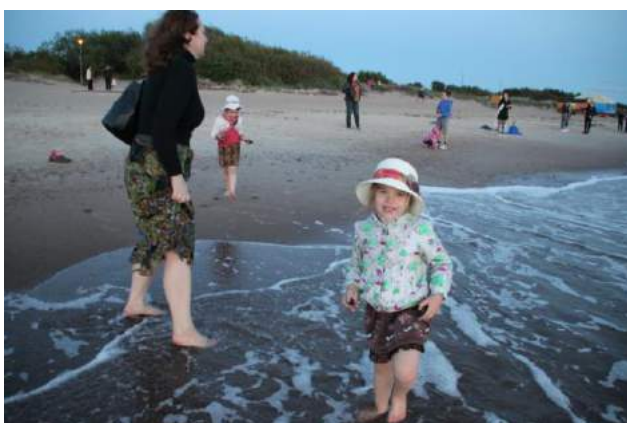
Ja visi tā priecātos kā jūra un mazi bērni!