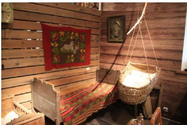
Kaut mums Latvijā vairāk kārtu šādu šūpuļu!