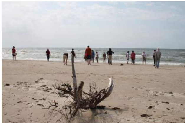
Tik vienkāršais un pievilcīgais liedags Bernātos.