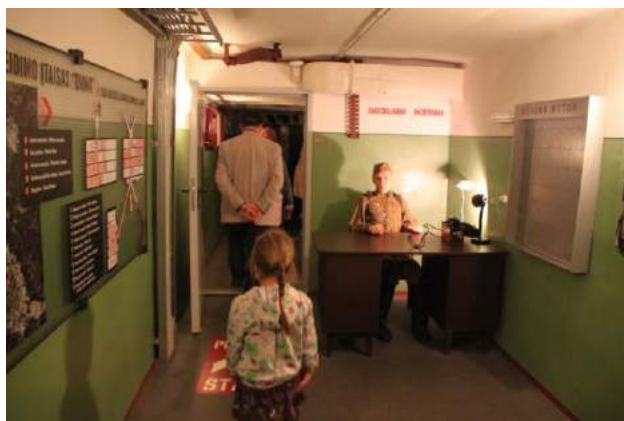
Aukstā kara muzejs bijušajā raķešu bāzē – mazliet baisi bet tik intriģējoši.