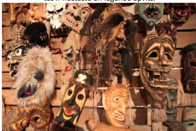
Etnogrāfiskās maskas jebkurai dzīves situācijai