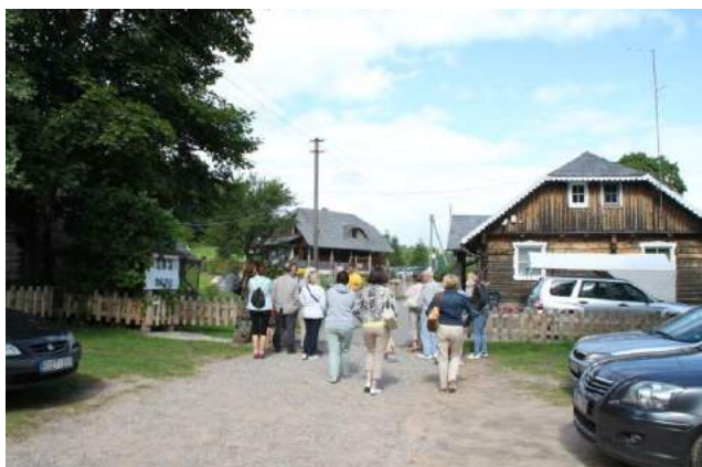
Klāt jau Enerģijas labirintu parks Lietuvā.