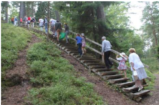
Ceļā uz jūras krastu Bernātos jāpārvar Latvijā augstākā kāpa – Pūsēna kalns.