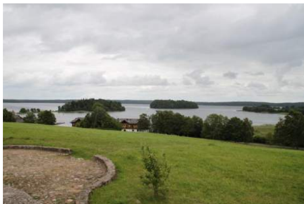
Plateļu ezers atrodas kalna galā. Tā krasti ir ličaini, tas ir nostāstu un leģendu apvīts.