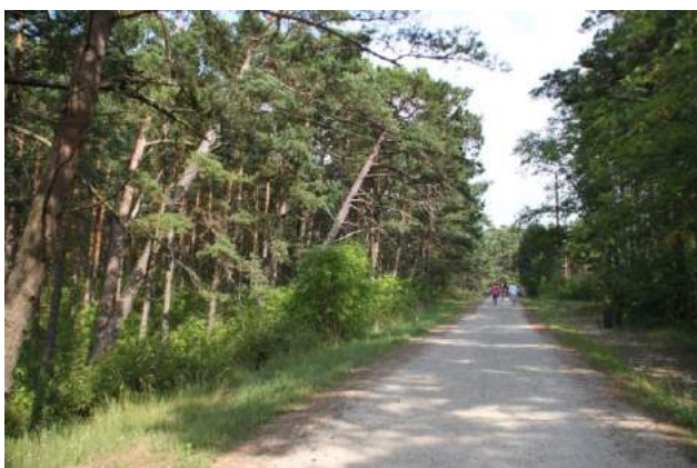
Bernātu dabas parka vēju locītās, bet nesalauztās priedes.