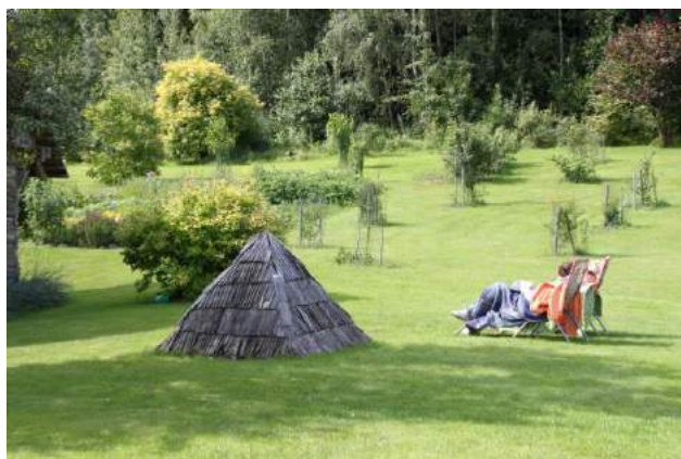
Ja meklējat paradīzi zemes virsū, tad tā ir šeit!