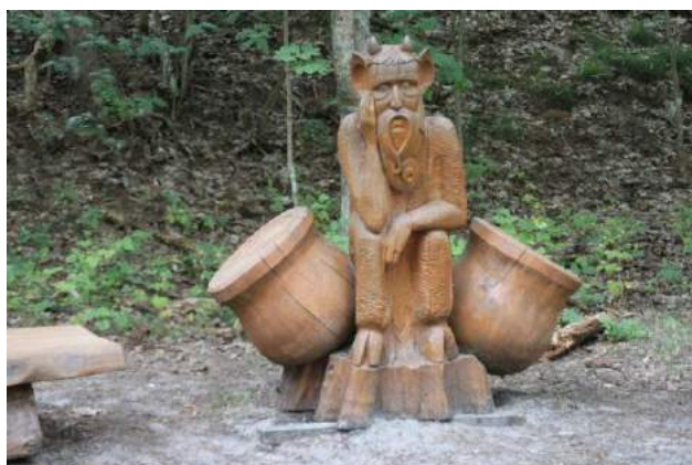
Velns viņu zina, ko tie statistiķi te meklē!