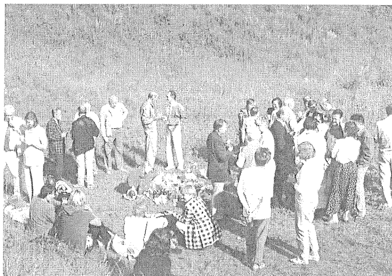
LSA biedri saviesīgās sarunās viesmīlīgajā Jūrkalnē.