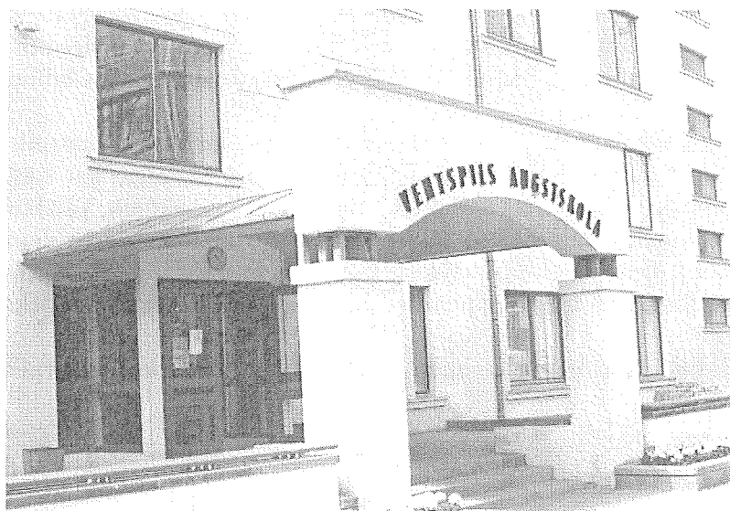
Ventspils augstskolas ēka

Ventspils augstskola ir jauna augstākā mācību iestāde. Tā dibināta 1997.g. 23. jūlijā, bet tās Satversme apstiprināta 1998.g. 17. novembrī. Ja 1997. gadā augstskolā mācības uzsāka 300 studentu, tad šajā gadā to skaits pieaudzis līdz 446, bet plānotais studentu skaits ir 710. Augstskolas studiju programmas ir pilnībā akreditētas uz 6 gadiem. Galvenais studiju virziens ir ekonomika un vadības zinātnes ar specializāciju no trešā mācību gada finansu pārvaldībā; mārketinga pārvaldībā; grāmatvedībā un auditā; loģistikā. Apgūstot šo studiju programmu, jaunie speciālisti iegūst bakalaura grādu, kas ļauj gan strādāt izraudzītajā specialitātē, gan turpināt studijas maģistrantūrā Latvijas vai ārzemju augstskolās. Paredzēts arī Ventspils augstskolā ar laiku veidot maģistrantūras studiju programmu.