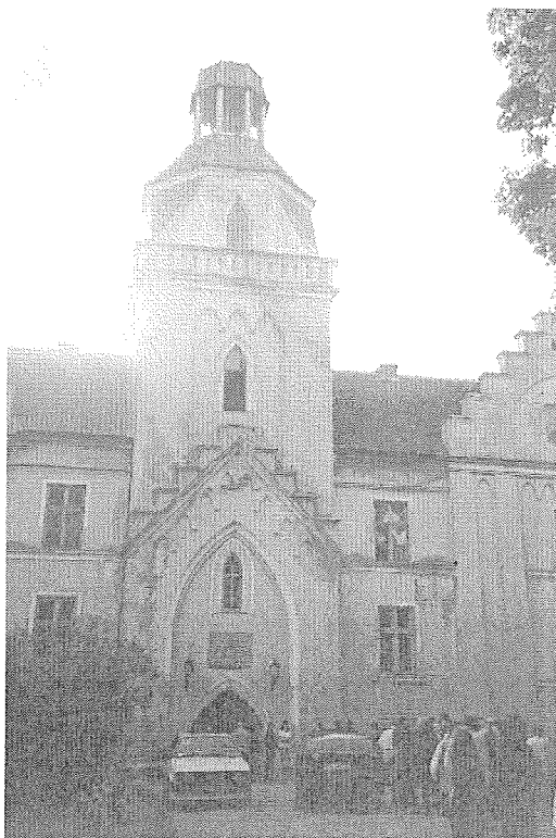
Ēdoles pils. Ceļojums tuvojas beigām...

Latvijas statistiķu asociācijas juridiskā adrese ir Lāčplēša ielā 1, Rīgā, LV-1301. Tālruni: 7366880 un 7366891, fakss 7830137, e-mail ivanags@csb.lv un igrizane@csb.lv . Ar LSA statūtiem un citiem ar asociāciju saistītiem materiāliem var iepazīties vai saņemt to kopiju LSA telpās.