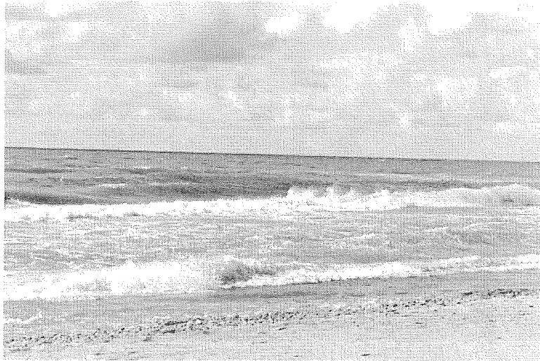
Nemierīgā Baltijas jūra pie Jūrkalnes