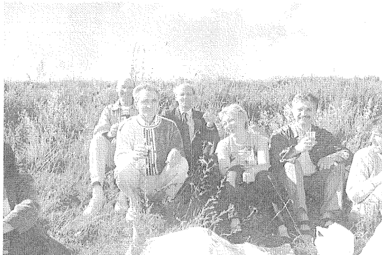
Piknika laikā Jūrkalnē.