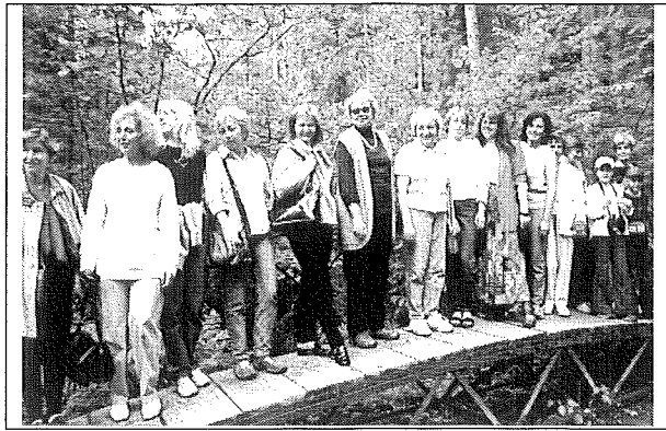
Vai šie "statistikas enģeļi" nav jauki!